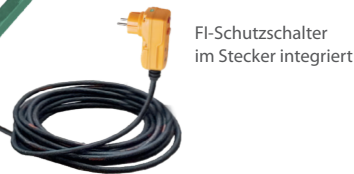
FI-Schutzschalter im Stecker integriert