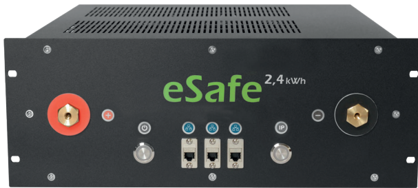
Niedervolt - Batteriemodul (Systemspannung 52 V)