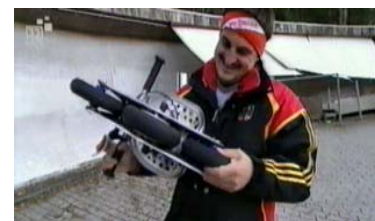
Ein prüfender Blick von Rodelweltmeister Schorsch Hackl